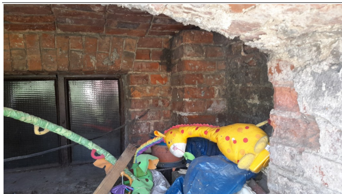
OKNO PIWNICZNE, OBUDOWA OKNA, OPASKA PRZY BUDYNKU – ZŁY STAN TECHNICZNY